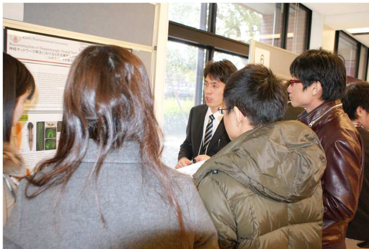
↑質疑応答兼会食の様子。 学部生・院生・教員が活発に質疑応答しました。