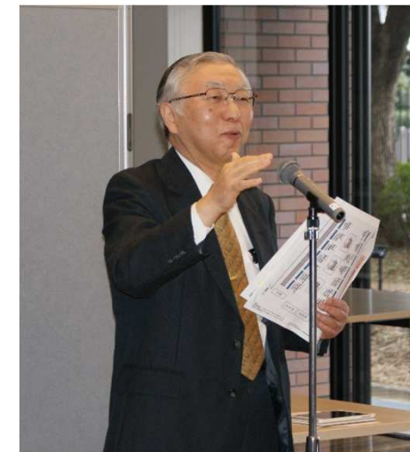
↑乾学長による総評。 会を締め上げて頂きました。