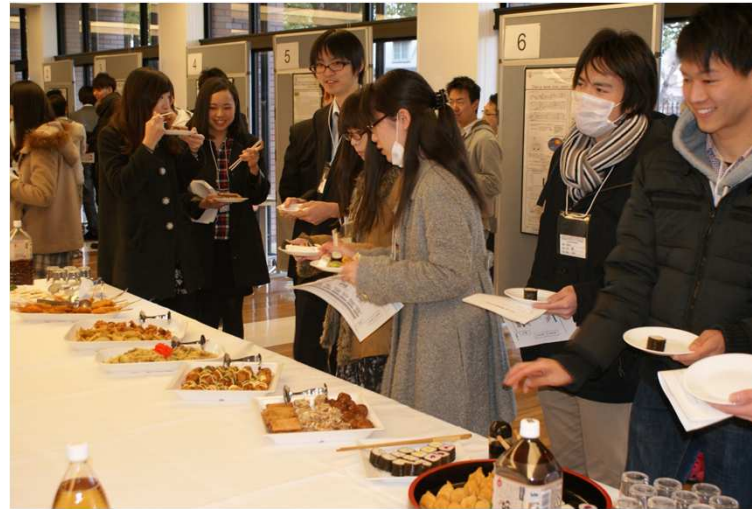
↑質疑応答兼会食の様子。 リラックスしながら、様々なテーマについて語り合っていました。